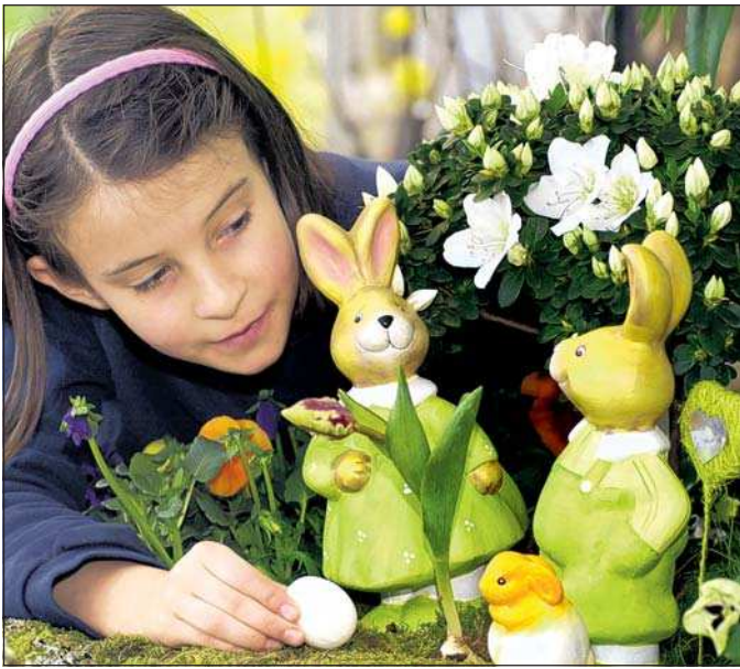
Osterhase und Osterei spielen in vielen anderen Ländern kaum eine Rolle zum jetzigen Fest.

In Polen werden am Karfreitag Speisen für das Frühstück am Ostersonntag gesegnet. Am Ostermontag besprengt man sich gegenseitig mit Wasser. In Griechenland ,